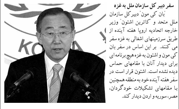
سفر دبیر کل سازمان ملل به غزه بان کی مون دبیر کل سازمان ملل متحد و کاترین اشتون وزیر خارجه اتحادیه اروپا هفته آینده از طریق سرزمینهای اشغالی به غزه سفر می کنند. بر این اساس در سفر بان کی مون و اشتون به غزه هیچ برنامه‌ای برای دیدار آنان با مقامهای حماس دیده نشده است. اشتون قرار است در سفر هفته آینده خود به منطقه همچنین با مقامهای تشکیلات خودگردان، مصر، سوریه و اردن دیدار کند.