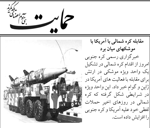
مقابله کره شمالی با آمریکا با موشکهای میان برد

خبرگزاری رسمی کره جنوبی امروز از اقدام کره شمالی در تشکیل یک واحد ویژه موشکی در ارتش برای مقابله با فعالیت‌های آمریکا در ژاپن و گوام خبر داد. این واحد ویژه در شرایطی شکل گرفته که کره شمالی در روزهای اخیر حملات لفظی خود علیه آمریکا و کره جنوبی را افزایش داده است.