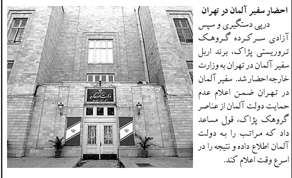
احضار سفیر آلمان در تهران در پی دستگیری و سپس آزادی سرکرده گروهک تروریستی پژاک، برنده اربل سفیر آلمان در تهران به وزارت خارجه احضار شد. سفیر آلمان در تهران ضمن اعلام عدم حمایت دولت آلمان از عناصر گروهک پژاک، قول مساعد داد که مراتب را به دولت آلمان اطلاع داده و نتیجه را در اسرع وقت اعلام کند.

سه روزنامه سوئدی به بهانه آزادی بیسان کاریکاتور موهنی که یک فرد سوئدی آن را کشیده بود در روزنامه‌های خود به چاپ رساندند.